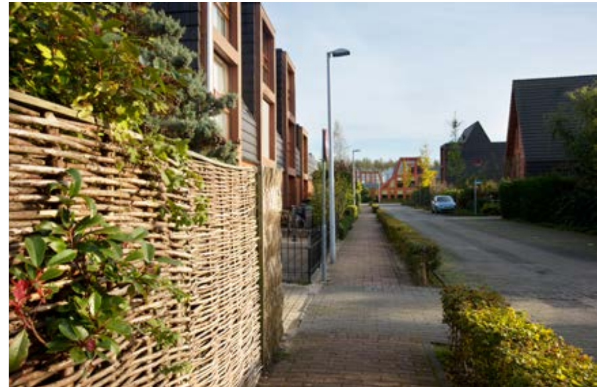
9817 Stellinghof, Vijfhuizen