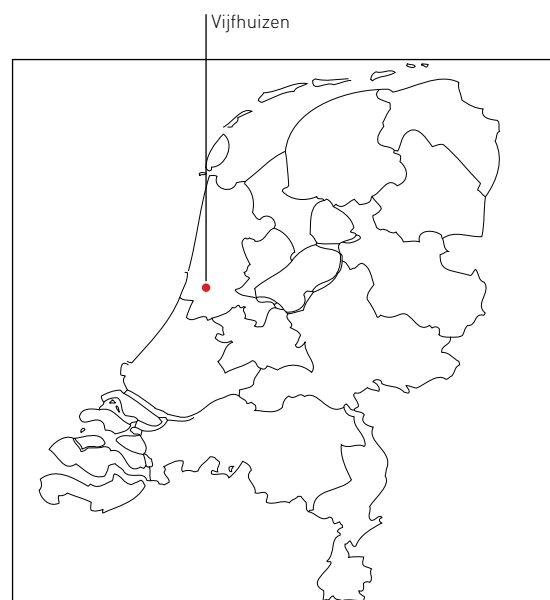
Vijfhuizen | in the Netherlands